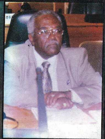
«የአሁኑ ረሀብ በአገራችን ታሪክ ትልቁ ነው...» አቶ ሸ.መልስ አዲኛ