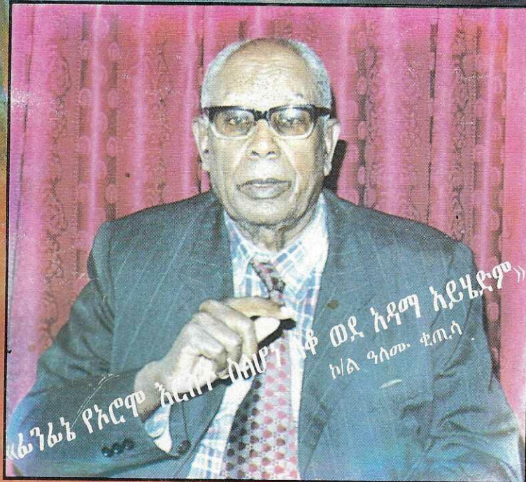
«ግለን መረጃ መሠረት 10,583 መምህራን ከስራቸው ተፈናቅለዋል ታስረዋል ተገድለዋል» አ.መማ

«ግለን መረጃ መሠረት 10,583 መምህራን ከስራቸው ተፈናቅለዋል ታስረዋል ተገድለዋል»